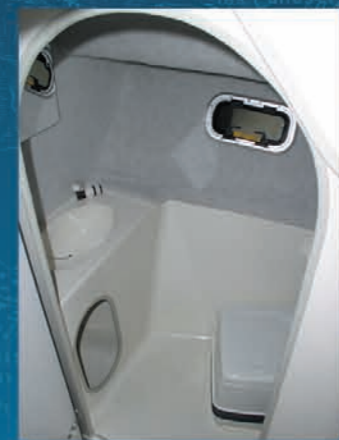
Cabinet de toilette. Washroom. Cuarto de aseo con lavamanos y WC químico de serie.