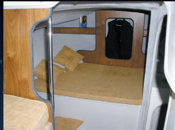
Cabine avant - couchage enfant. Forward cabin - bedding for children. En la parte delantera de la cabina - 1 cama de niño.