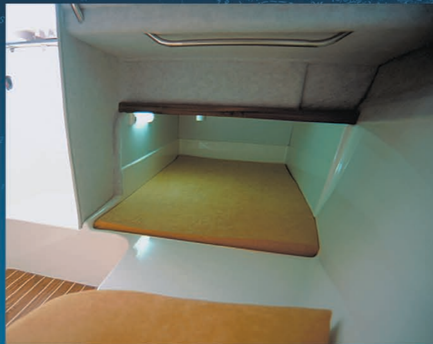
La Mid-Cabine placée sous le carré peut recevoir deux adultes. Mid-Cabin under saloon can receive 2 adults. A media cabina, bajo el salón - 1 cama para 2 adultos.