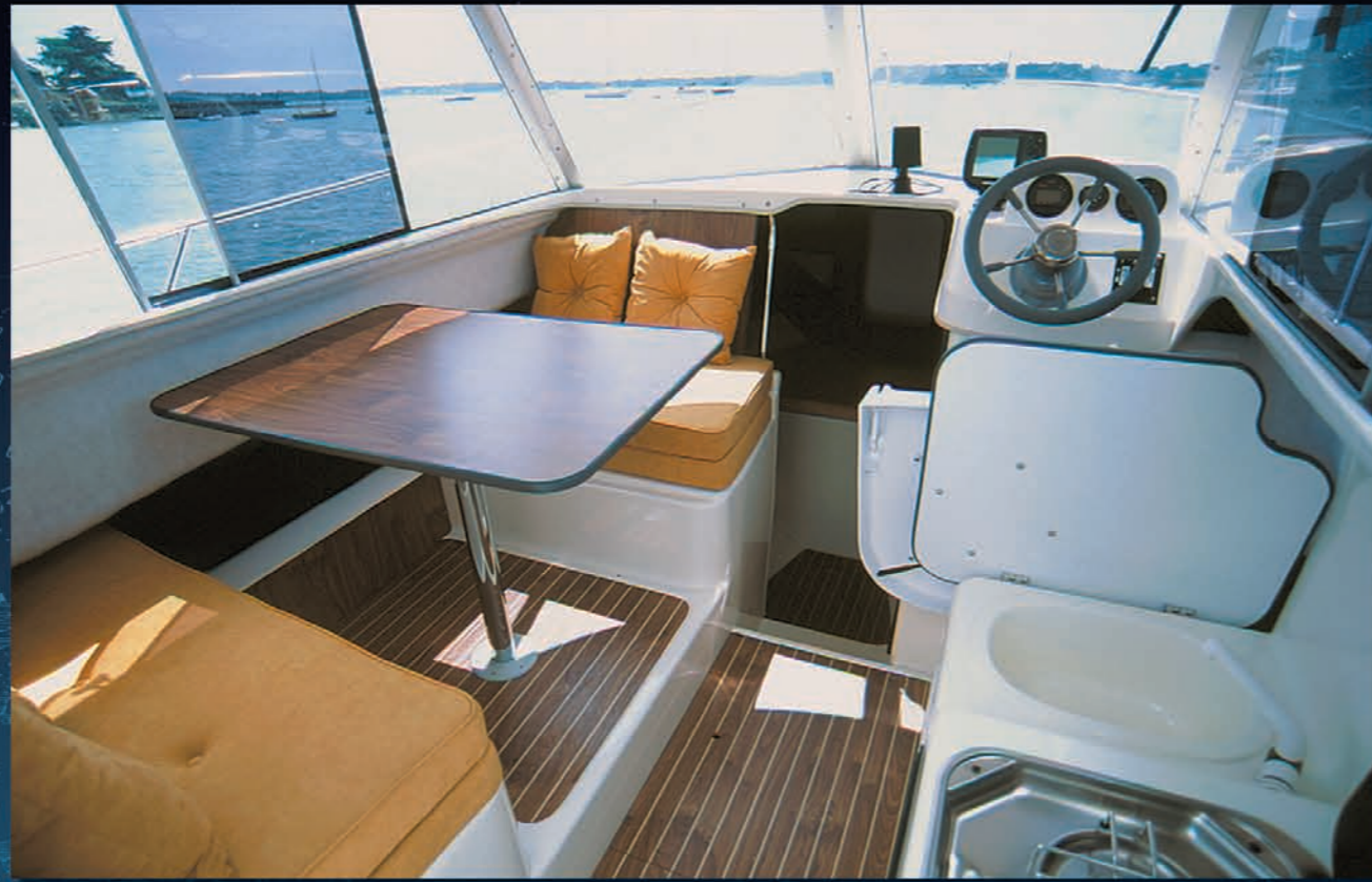
Un carré convivial et panoramique. Convivial and panoramic saloon. Una cubierta panorámica y de segura utilización.