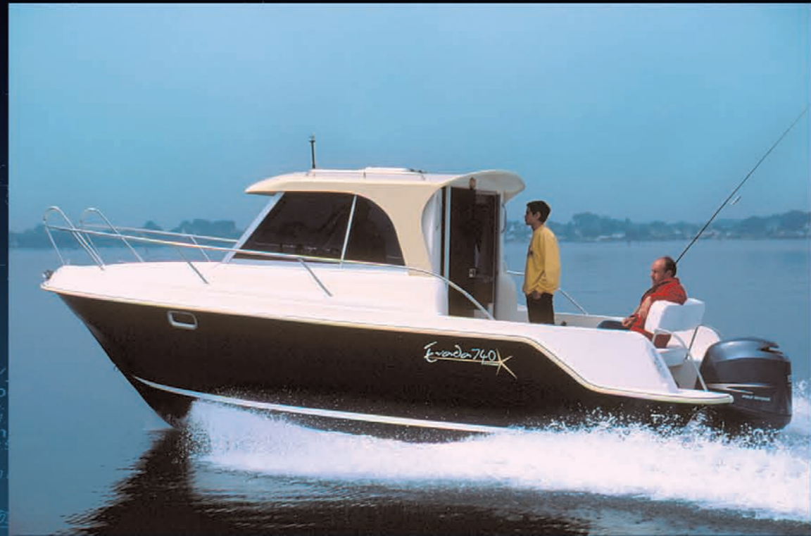
Ligne élégante, excellent comportement en navigation. Elegant line - excellent behaviour at speed. Línea sobria y elegante - excelente comportamiento en navegación.