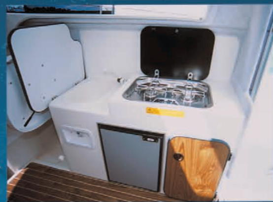
Cuisine - évier - réfrigérateur. Galley - sink - fridge. Cocina - fregadero y frigorífico de serie.