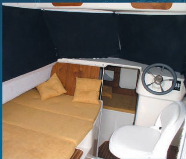
Rideaux et confort pour la nuit. Curtains and comfort for night. Cortinas y comodidad nocturna.