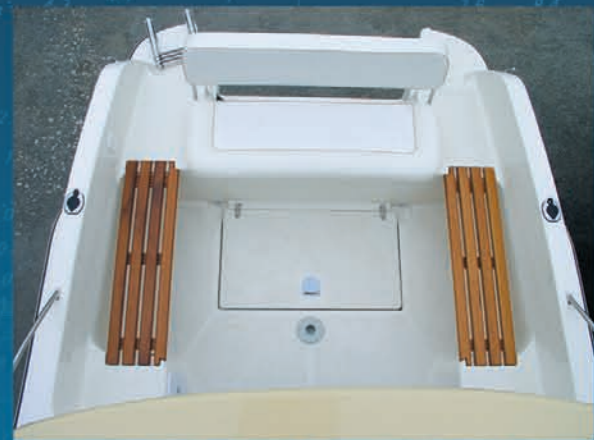
Spacious cockpit transformable in saloon deck. Espaciosa bañera transformable en salón.