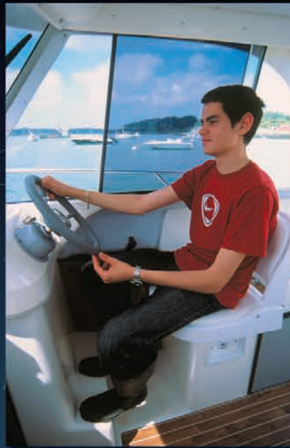
Poste de pilotage confortable. Comfortable steering station. Posición de gobierno estudiado para un mayor confort.