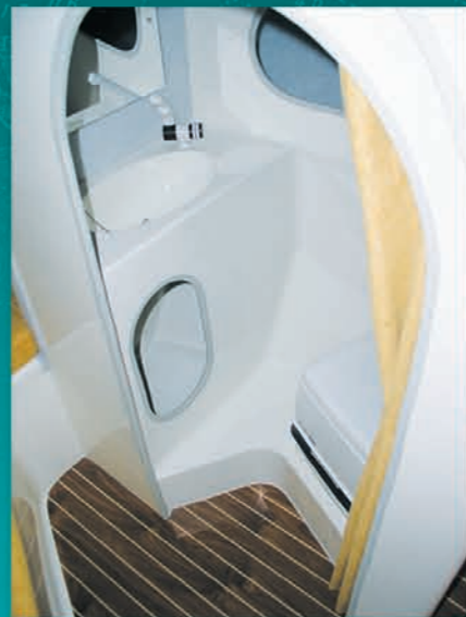
Cabinet de toilette Washroom. Cuarto de aseo con lavamanos y WC químico de serie.