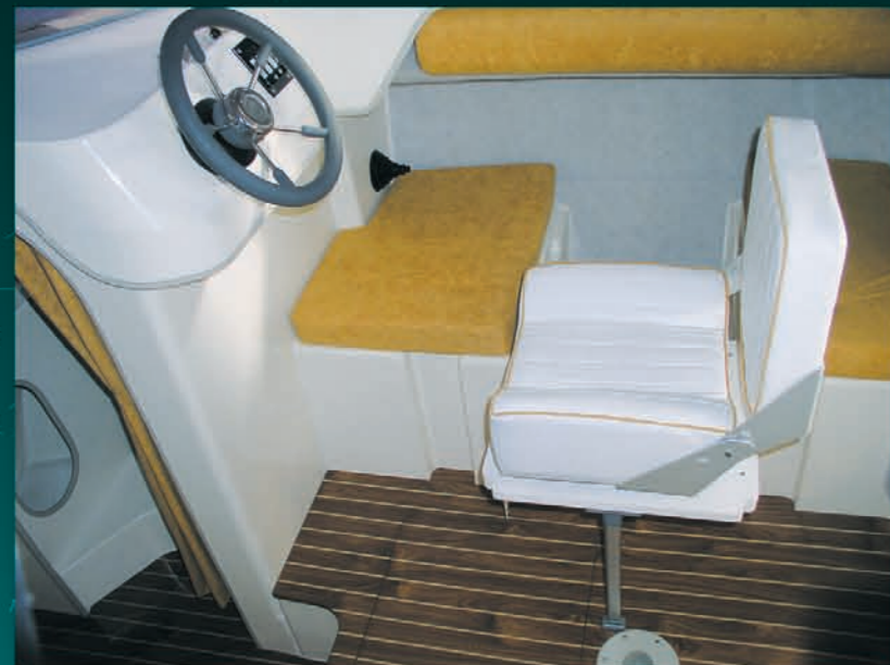
Poste de pilotage confortable. Comfortable steering station. Posición de gobierno estudiado para un mayor confort.