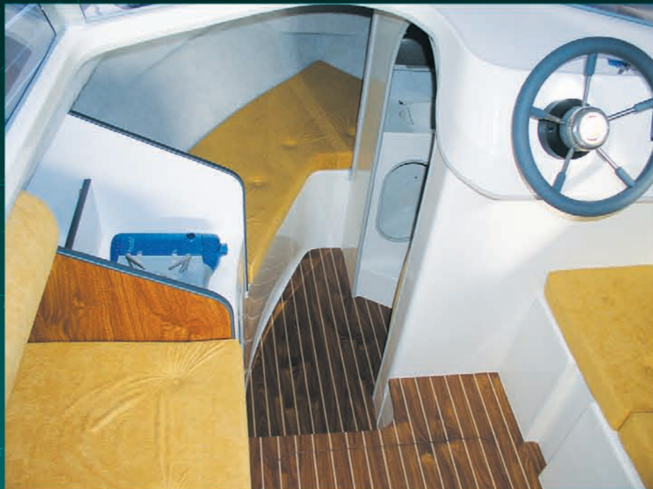
Un carré convivial et panoramique. Convivial and panoramic saloon. Una cubierta panorámica y de segura utilización.