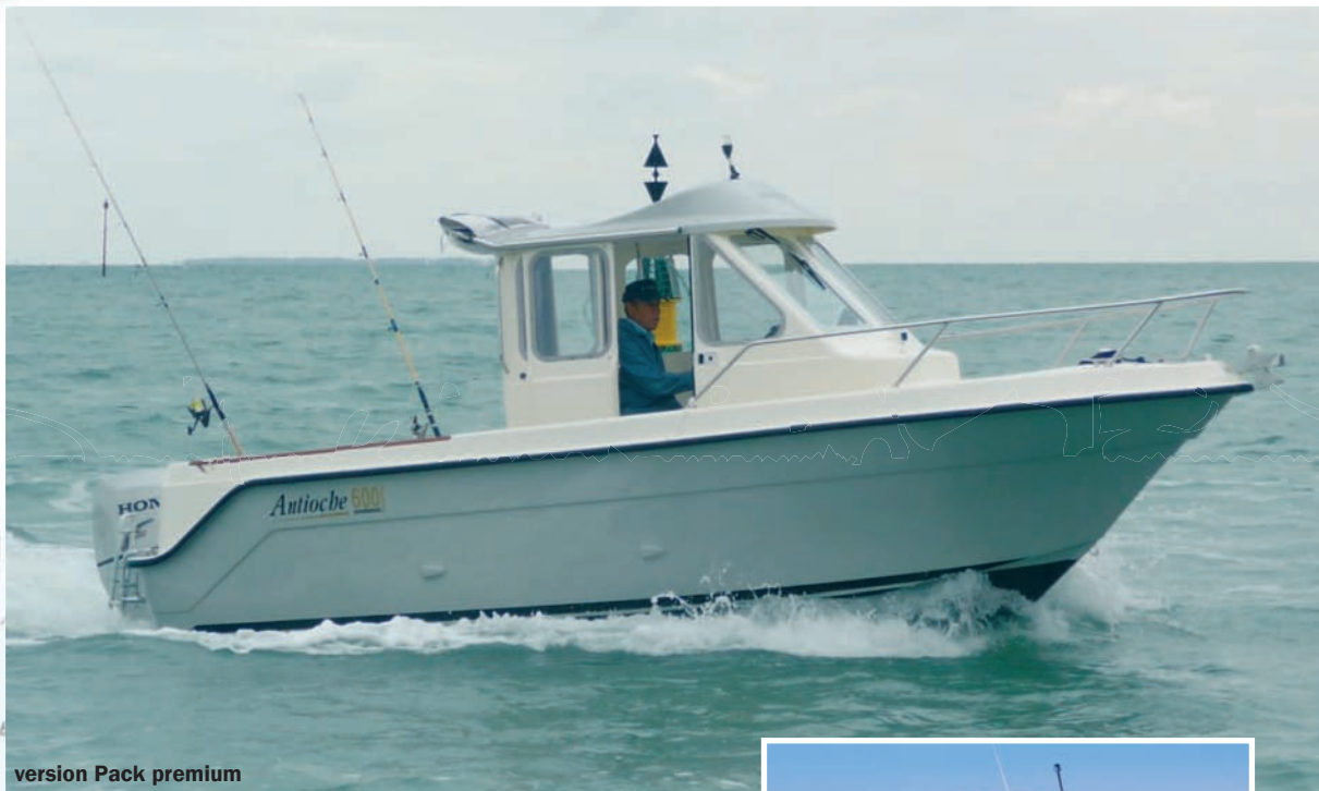
version Pack premium